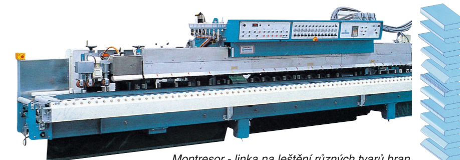
Montresor - linka na leštění různých tvarů hran