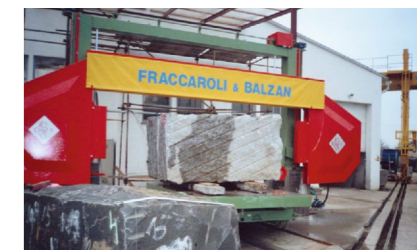
Fraccaroli & Balzan - lanová pila