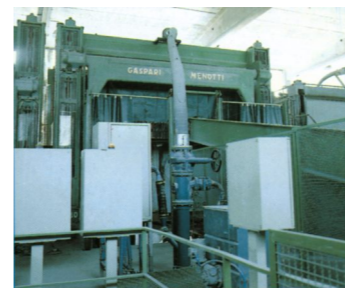
Karty Gaspari Menotti

Dodací lhůty: 2 až 3 týdny; skladem: cca 8000 m 2 desek