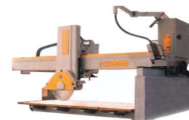
GMM - kotoučová pila